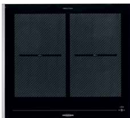
FLI 2068 GRILL mit Edelstahl-Seitenleisten