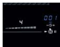
Übersichtlich: Slider-LED Weiß, Timer-LED Blau